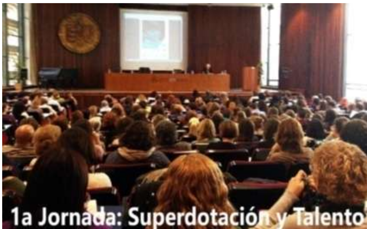
Organizada por el Instituto Valenciano de Altas Capacidades. Aula Magna de la Facultad de Ciencias de la Educación de la Universidad de Valencia, 25 de enero de 2014

Con frecuencia, funcionarios del asesoramiento psicopedagógico de las escuelas o de orientación de los institutos de secundaria, siguen realizando el diagnóstico, le llaman "evaluación psicopedagógica" y niegan a los padres el informe con los resultados aduciendo que se trata de "información confidencial e interna". Los padres, en el desconocimiento de las pruebas que han efectuado a su hijo, y de sus derechos básicos, no pueden, por tanto, encargar un diagnóstico en un centro especializado hasta haber transcurridos dos años, ya que para la validez de las pruebas un niño no puede realizar una misma prueba hasta que no hayan transcurrido dos años. El Defensor del Estudiante en su web http://www.defensorestudiante.org/ ha tenido que habilitar el espacio: http://defensorestudiante.org/de/archivos/pdf/derecho_escolar.pdf para ayudar a los padres en la defensa de sus elementales derechos, con la colaboración de la Agencia Española de Protección de Datos, y crear una alerta para todos los padres. http://defensorestudiante.org/de/archivos/pdf/ALERTA_A_TODOS_LOS_PADRES.pdf