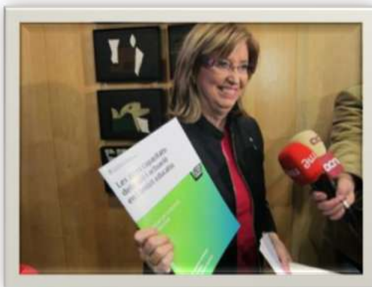
La Consejera de Educación (d'Ensenyament) de la Generalitat de Catalunya Irene Rigau, en el acto de presentación de su “guía” a los medios de comunicación

(Más información en el Capítulo VII: “La educación en nuestras leyes y en nuestra Jurisprudencia. El Derecho a la Educación en Libertad”, pág. 68, y en el Capítulo XI, “El Defensor del Estudiante”, pág. 99 - 105).